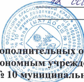
График оказания платных дополнительных образовательных услуг, оказываемых муниципальным автономным учреждением дополнительного образования спортивной школой № 10 муниципального образования город- курорт Анапа, на 2024 – 2025 учебный год